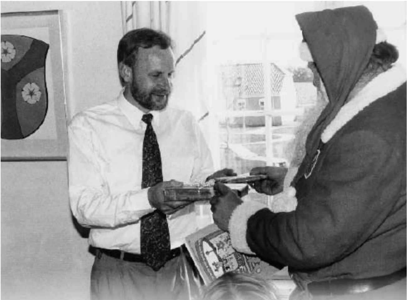
Af Finn Brunse

Vi må vel sige, at uanset enkelte kritiske synspunkter om Kulturlandsby 96/Hele verden til Tommerup, så blev dette initiativ og den lange række af arrangementer i tilknytning hertil, et af årets store begivenheder.